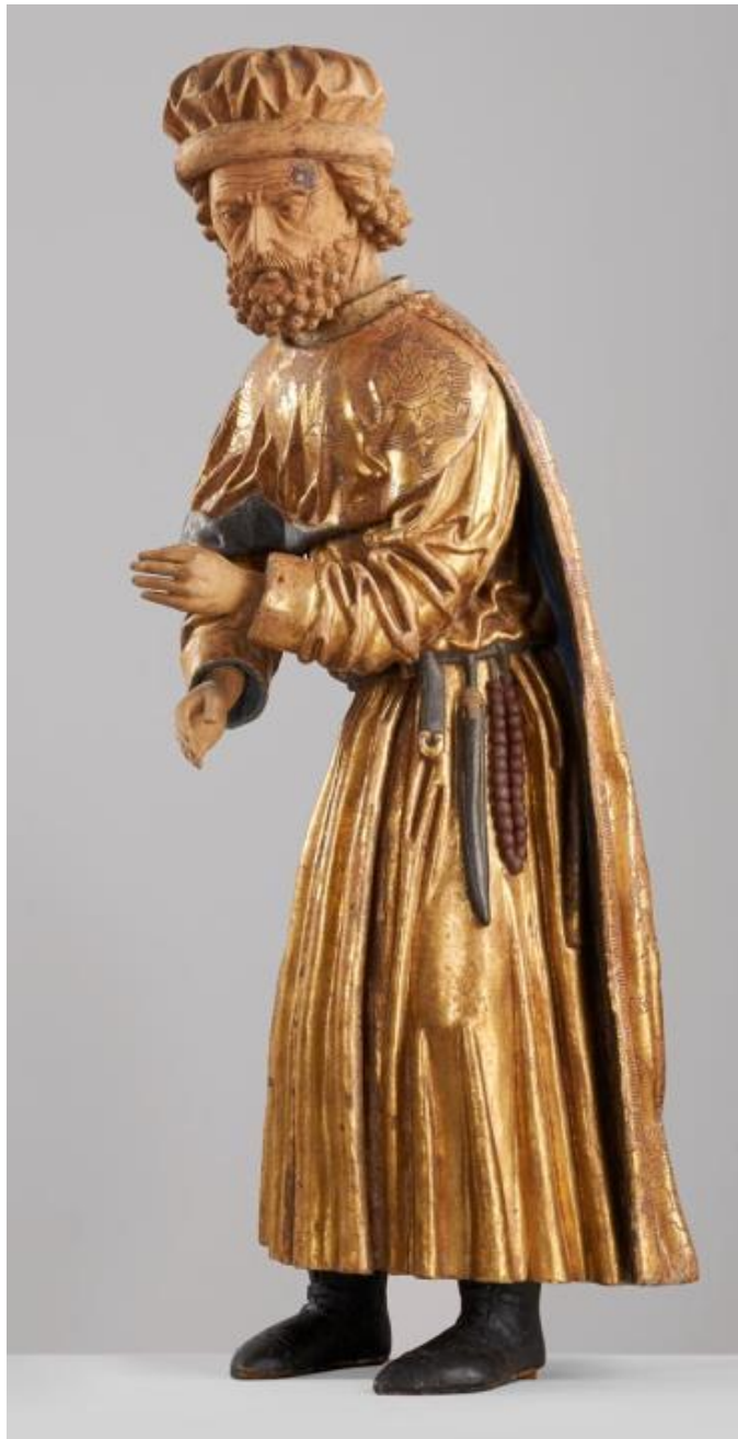
Skulptur Heiliger Josef